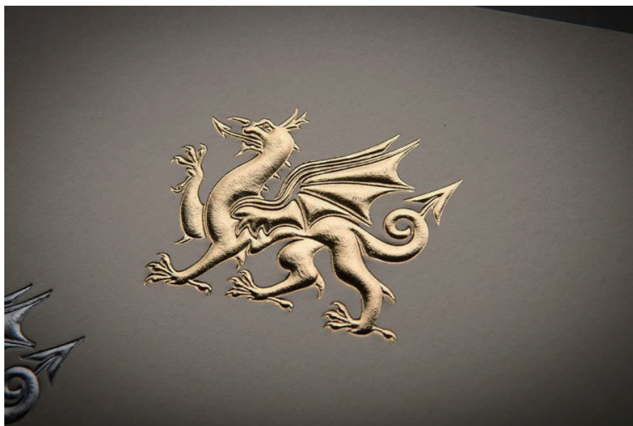
肉付けとい方法で盛り上げた状態＋箔押し